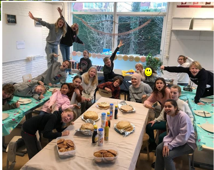
Groep 8: Pannenkoeken na de doorstroomtoets