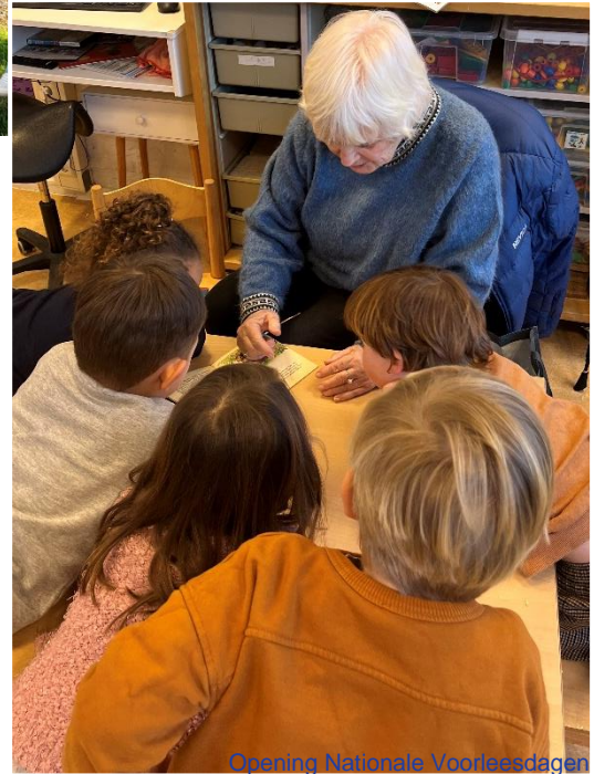
Opening Nationale Voorleesdagen