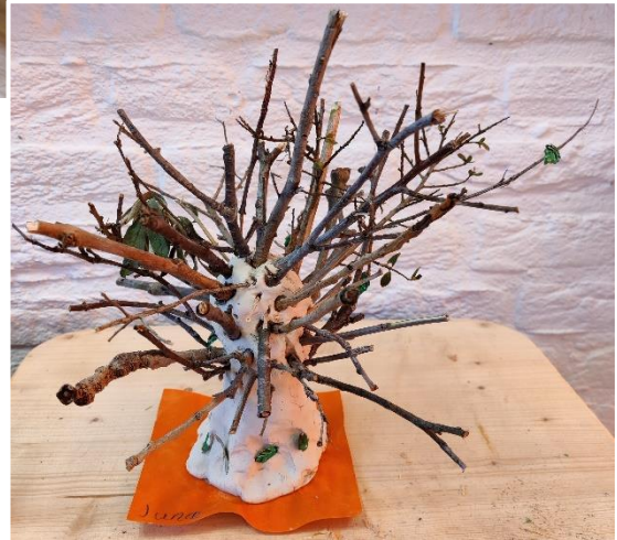
Een boom voor de stad die groep 6 gaat bouwen.