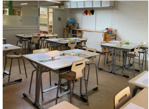
Klaar voor de start!