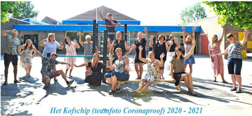
Het Kofschip (teamfoto Coronaproof) 2020 - 2021