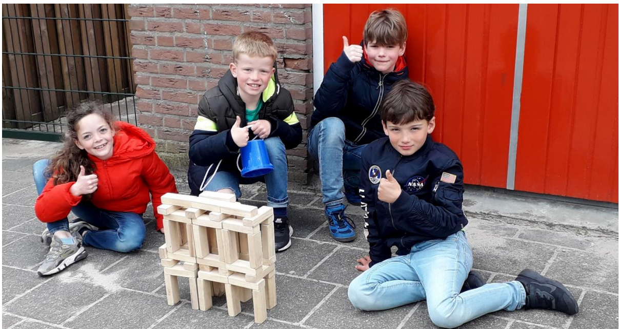
Fijn spelen tijdens de overblijf