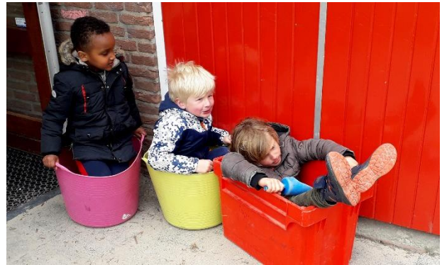
Fijn spelen tijdens de overblijf