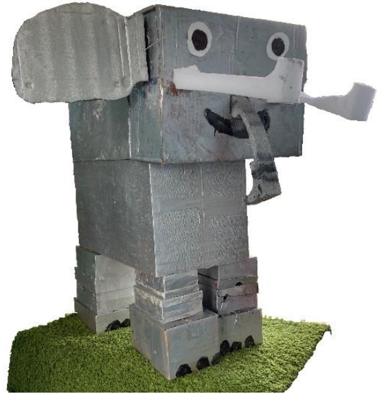
Groep 7 knutselde een olifant (Afrika & Azië-project)