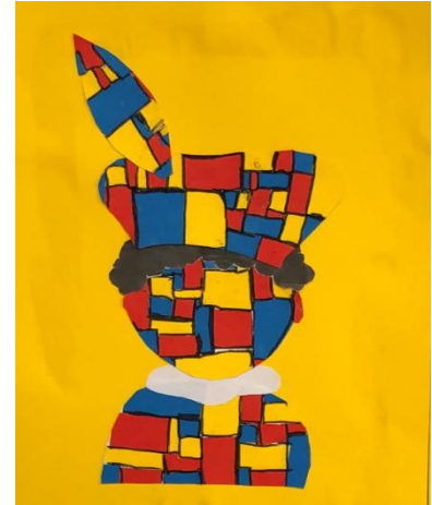
Mondriaanpiet in groep 4